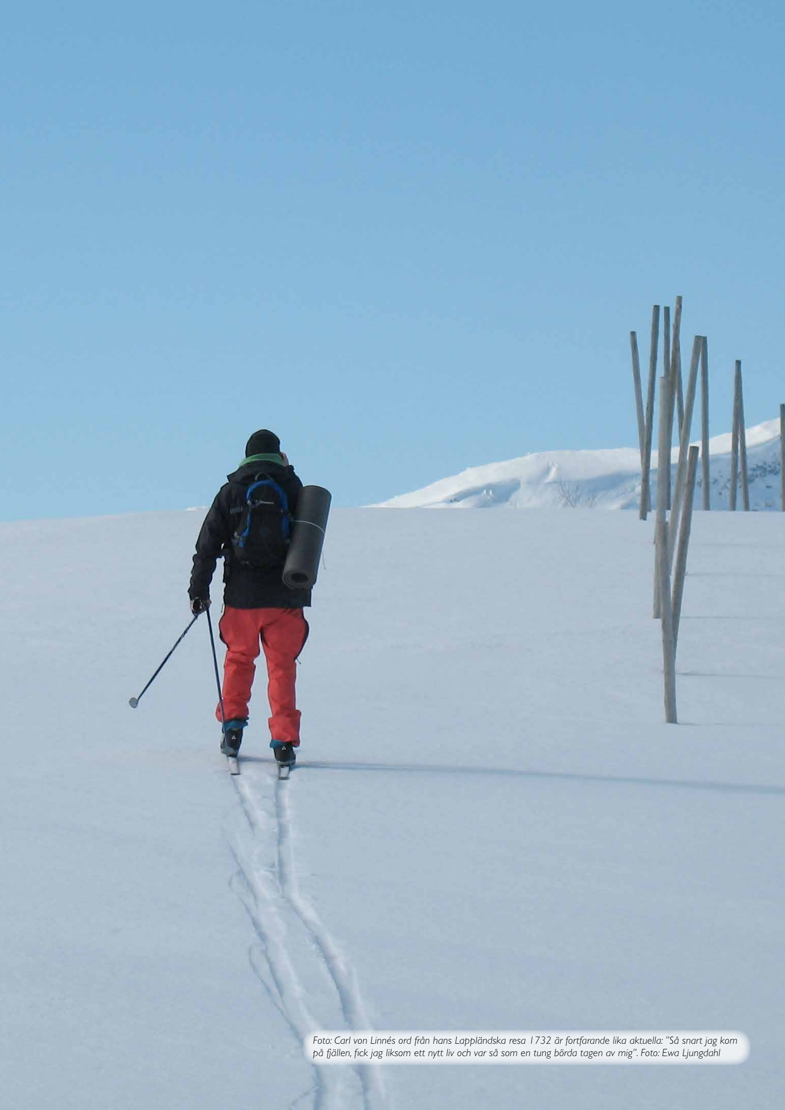
Foto: Carl von Linnés ord från hans Lappländska resa 1732 är fortfarande lika aktuella: "Så snart jag kom på fjällen, fick jag liksom ett nytt liv och var så som en tung börda tagen av mig". Foto: Ewa Ljungdahl