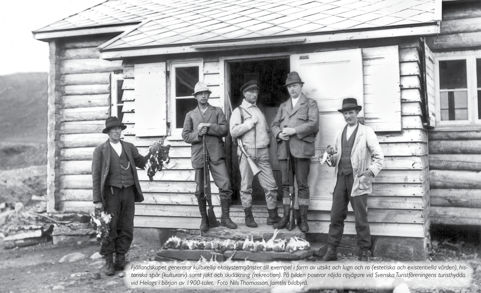
Fjällandskapet genererar kulturella ekosystemtjänster till exempel i form av utsikt och lugn och ro (estetiska och existentiella värden), historiska spår (kulturarv) samt jakt och skidåkning (rekreation). På bilden poserar nöjda ripjägare vid Svenska Turistföreningens turishydda vid Helags i början av 1900-talet.

värderar och tar hänsyn till fjällandskapets kulturarv och identitet, vid fysisk planering på kommunal och regional nivå.