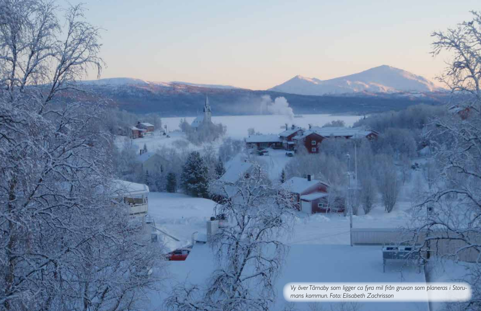
Vy över Tärnaby som ligger ca fyra mil från gruvan som planeras i Storumans kommun.

viktigt steg på vägen mot en gruva. I Jokkmokksfallet har Länsstyrelsen i Norrbotten avstyrkt. Om Bergsstaten vill bevilja en bearbetningskoncession trots att berörd länsstyrelse sagt nej, så måste ärendet avgöras av regeringen. Där ligger nu Jokkmokksfallet. I fallet Rönnbäck/Rönnbäcken överklagades beslutet om bearbetningskoncession till regeringen, bland andra av den mest berörda samebyn, men regeringen ändrade inte beslutet.