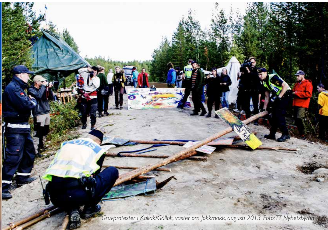
Gruvprotest i Kallak/Gállok, väster om Jokkmokk, augusti 2013.