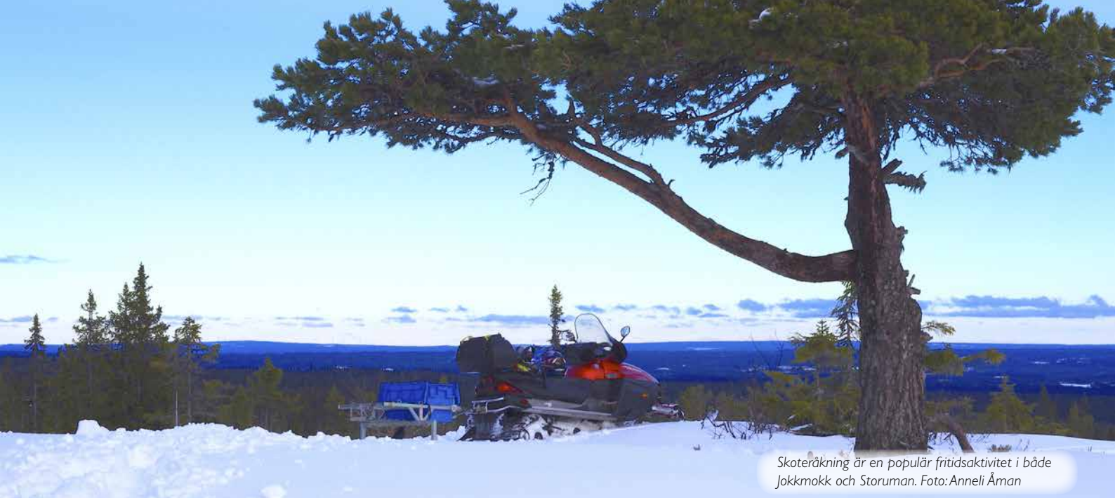
Skoteråkning är en populär fritidsaktivitet i både Jokkmokk och Storuman.

– Gruvan ses som en möjliggörare, fortsätter Karin. Aktörer som argumenterar för Livskvalitet med lokal nytta befinner sig lite mittemellan. Skillnaderna mellan de här synsätten avspeglar ett antal grundläggande tankefigurer. De handlar om ekonomisk tillväxt, befolkningsutveckling, förhållandet mellan människa och natur, tidsperspektiv och geografisk skala.