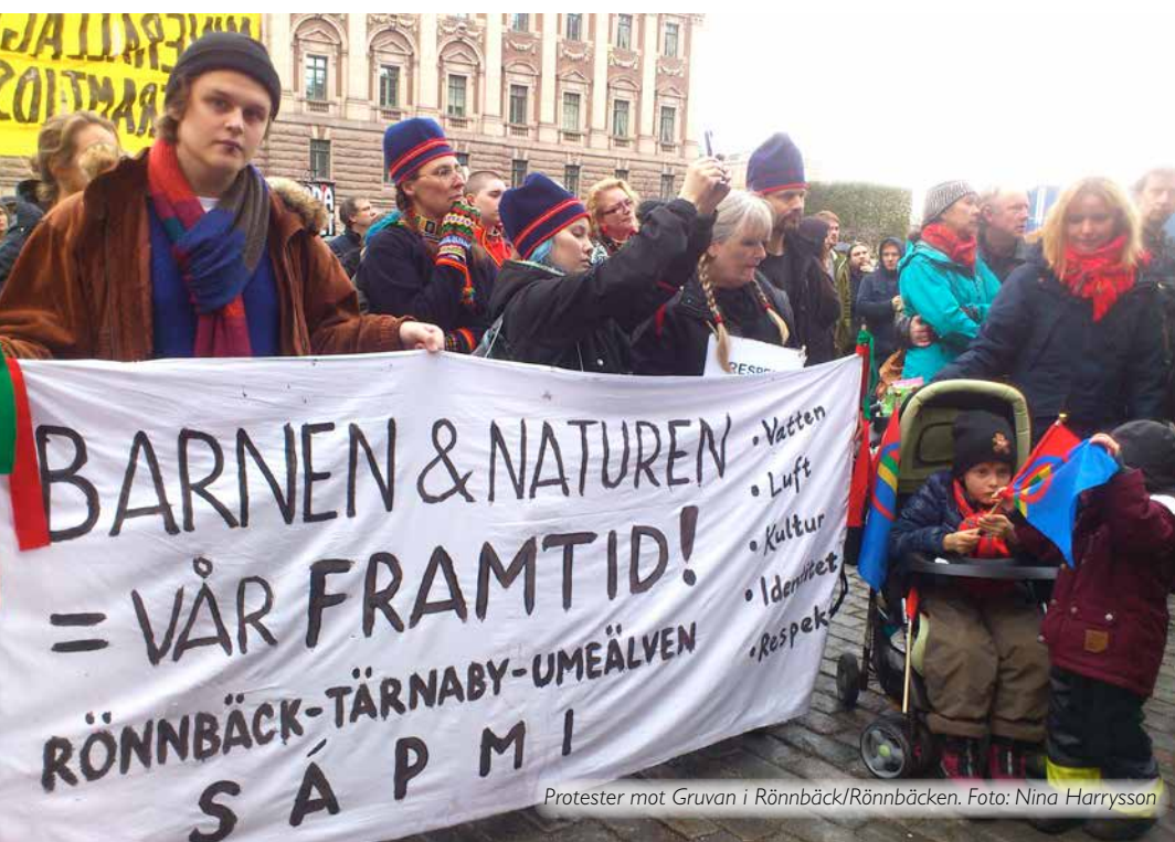
Protester mot Gruvan i Rönnbäck/Rönnbäcken.

Så här långt i processerna verkar dock kommunerna ha haft ett visst inflytande i Rönnbäck/Rönnbäcken och Kallak/Gällöck. Även samebyarna verkar kunna utöva viss påverkan, framför allt i Jokkmokksfallet där berörda samebyar har samarbetat med varandra. De har ett relativt utbrett lokalt stöd, är jämförelsevis stora och resursstarka samt underrättades i god tid om gruvbolagets ansökan om bearbetningskoncession. Den mest berörda