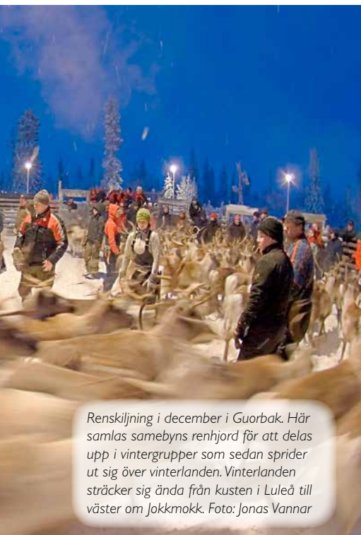
Renskilning i december i Guorbak. Här samlas samebyns renhjord för att delas upp i vintergrupper som sedan sprider ut sig över vinterlandens. Vinterlandens sträcker sig ända från kusten i Luleå till väster om Jokkmokk.

Så här långt verkar lokala och andra gruvskaptiska aktörer ha haft mer inflytande i Jokkmokksfallet än i Storuman. Vilken betydelse detta haft för de beslut som fattats är dock osäkert. Länsstyrelsen i Västerbotten har i Storumanfallet tillstyrkt bearbetningskoncession, vilket är ett