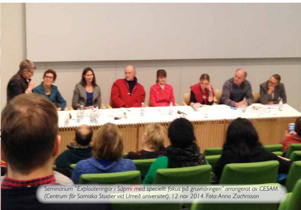
Seminarium "Exploateringar i Sápmi med speciellt fokus på gruvnäringen" arrangerat av CESAM (Centrum för Samiska Studier vid Umeå universitet), 12 nov 2014.