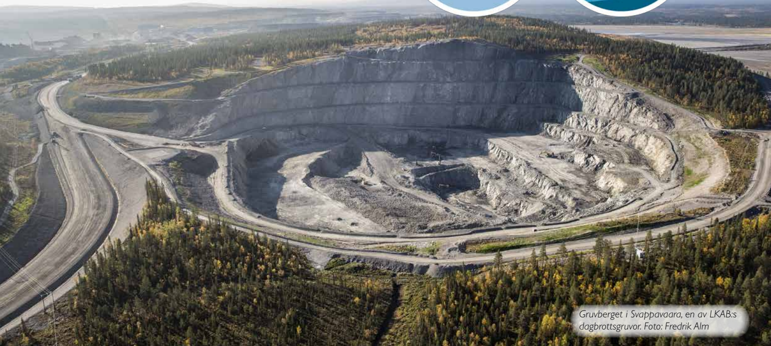
Gruvberget i Svappavaara, en av LKAB:s dagbrottsgruvor.